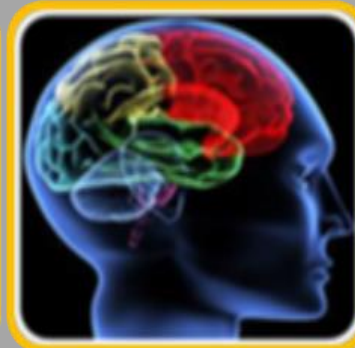
מוח, קוגניציה ועיסוק

* תפקוד ואי תפקוד של מערכות החישה * עיבוד חושי לאורך מעגל החיים * הפרעות בעיבוד חושי: התערבות * יישומים קליניים – מהערכה להתערבות