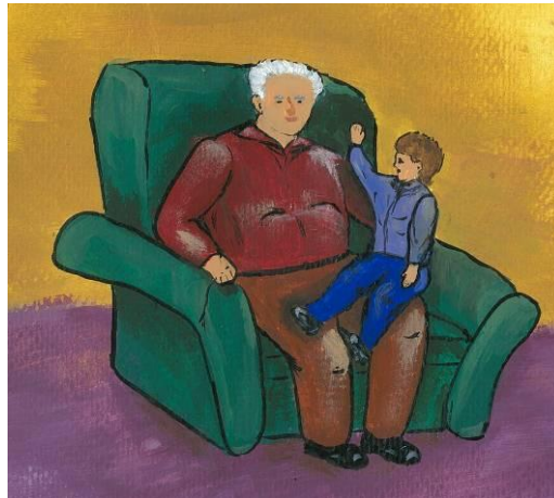
איור 1 : ניסיון ראשון לציור, ילד מעוות.

לסיכום: כתבתי את הספר מתוך תחושת מחויבות להעביר הלאה לדורות הבאים את מעשה ההעפלה והגבורה של אנשים, שנאבקו בנחישות לעלות לארץ ישראל ולבנות בה מדינה ליהודים. ובדרך עברתי גם חוויה רגשית מתקנת. בהתחלה וגם בדרך התהליך היה מאד קשה וטעון עבורי, היום אני מרוצה שעברתי את החוויה. הספר כולל נקודות דרך היסטוריות של העם היהודי בכלל ומתוך חייו של אבי בפרט, מלבד זאת הספר כולל נקודות פסיכולוגיות שהיה לי חשוב להאיר.